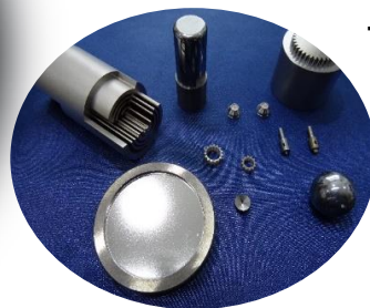
丸物加工サンプル品